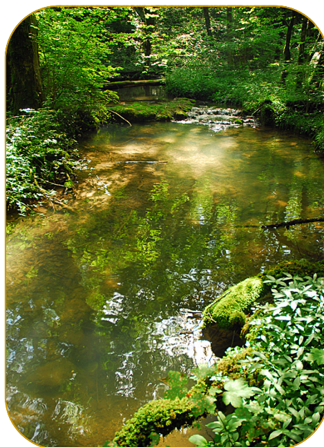
Le Val Clavin au Sud d'Auberive