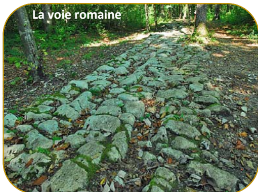
La voie romaine